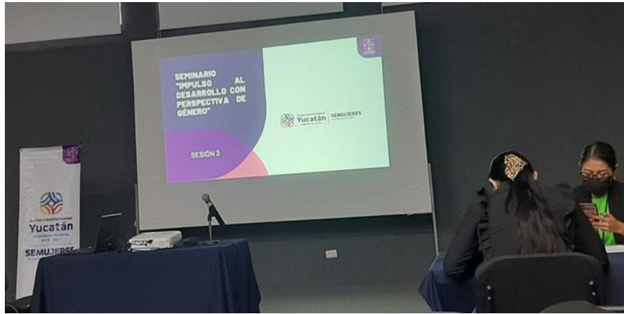
IMAGEN 8 Seminario “Impulso al Desarrollo con Perspectiva de Género” Módulo 3