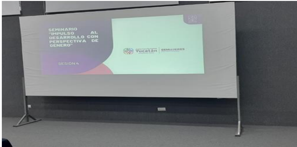
IMAGEN 10 Seminario "Impulso al Desarrollo con Perspectiva de Género" Módulo 4