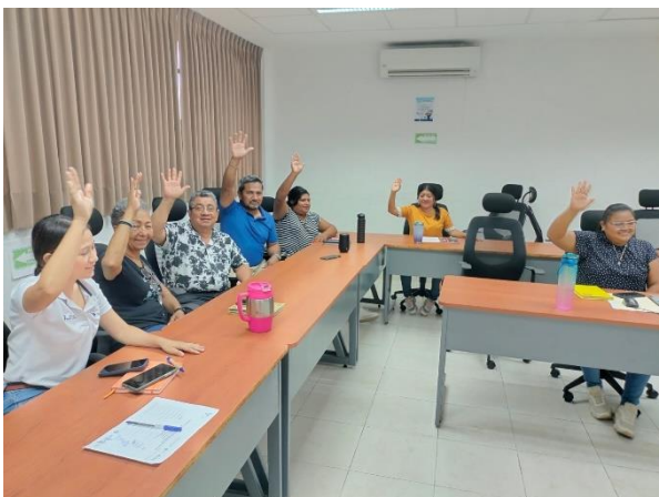
Difusión de correo electrónico en recibos de nómina