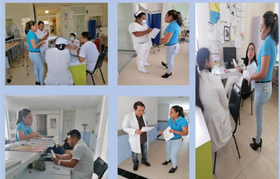
Difusión del protocolo de atención a quejas comportamiento no ético y el acoso sexual a personal de HACM.

Se continuo con la difusión del protocolo de atención a quejas por comportamiento no ético y el acoso sexual entre trabajadores del HACM.